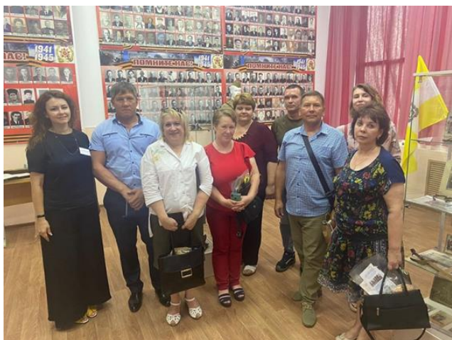
Краевой семинар август 2022г