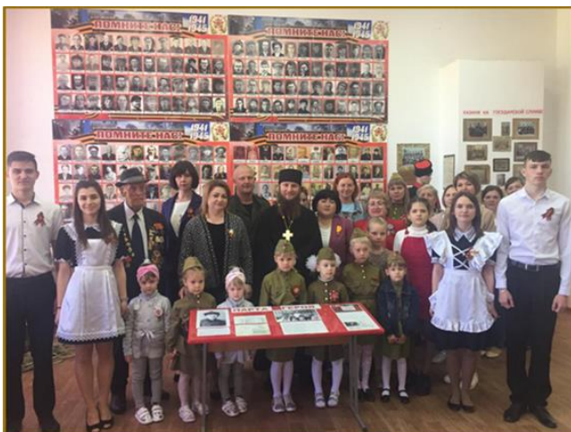
Открытие парты Героя