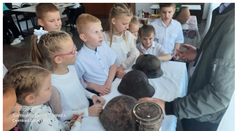
Школьное мероприятие покровская ярмарка.